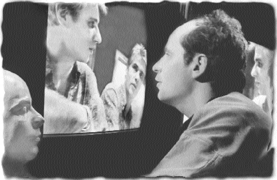
Jean-François Ringot Photographe et vidéaste