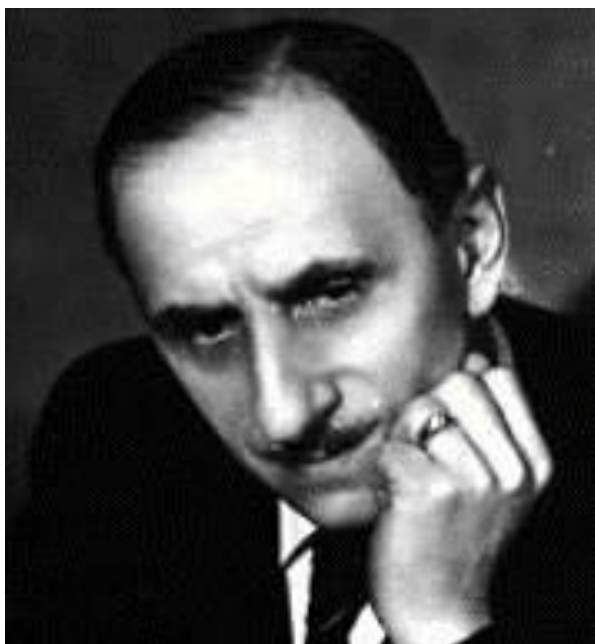
VINCENT SCOTTO 1876-1952 – Compositeur

Il nous a légué une soixantaine d'opérettes et près de quatre mille chansons parmi lesquelles : J'ai deux amours, Sous les ponts de Paris (1913), Le plus beau de tous les tangos du monde (1934) et La Java bleue (1938).