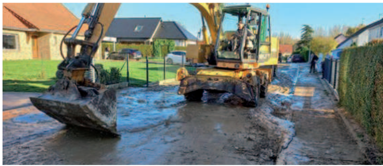
Nettoyage à Westrehem