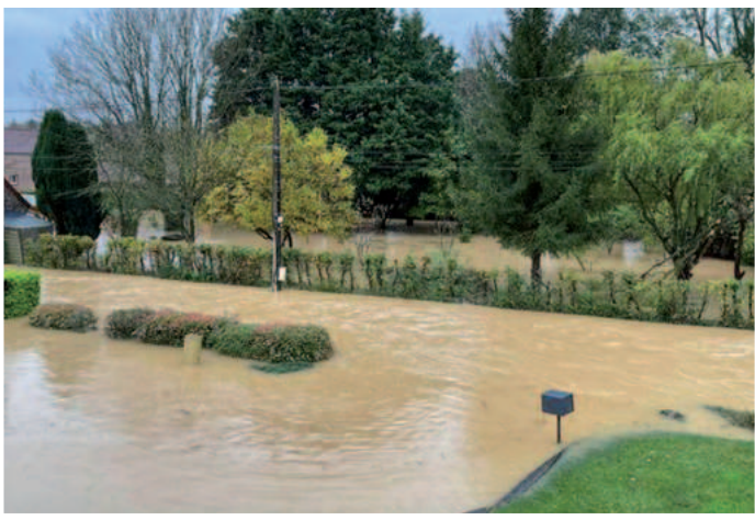
Rue des Prés