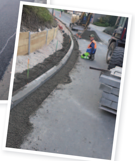
Mise en sécurité du virage rue des Deux Opens : Ducrocq TP et Département Coût : 48 910.80 € - Coût Commune : 48 910,80€