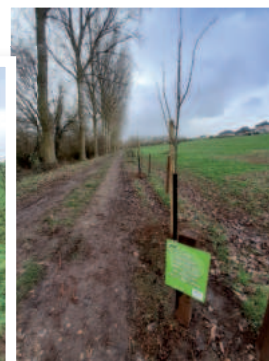
Plantations rue Carluis Stéphane Régnier - Coût 6029€ Subventions FIETT 4 160€ - Coût Commune : 1 869€