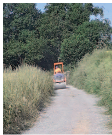
Traitement de chemins ruraux avec matériel de récupération : CAPSO - Coût Commune : 896€