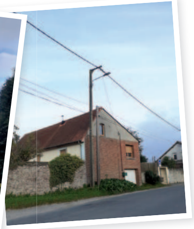
Rénovation éclairage public Upen d'Amont et route d'Upén d'Amont : Blot électricité, Coût : 19 560.10€, Subvention : FDE : 7 800€, Fonds vert : 3 260€ - Coût Commune : 8 560,10€