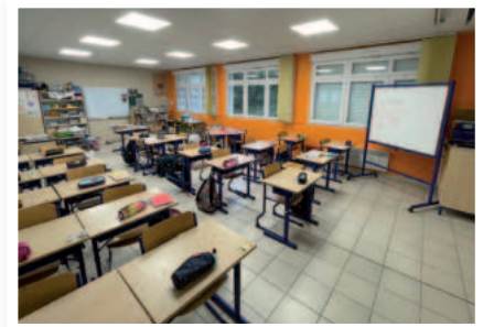
Rénovation de deux classes du groupe scolaire Employés municipaux - Coût Matériel : 604 €