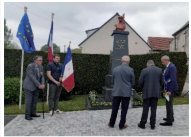
Le 8 mai 2023.

Le 11 novembre 2023, fut annulé pour cause d'inondation. De ce fait, le 5 décembre 2023, dépôt d'une gerbe au monument aux morts en souvenir des « Morts pour la France » pendant la guerre d'Algérie et les combats en Tunisie et au Maroc avec un hommage puis appel des enfants de la commune « Morts pour la France » pendant les 2 guerres mondiales.