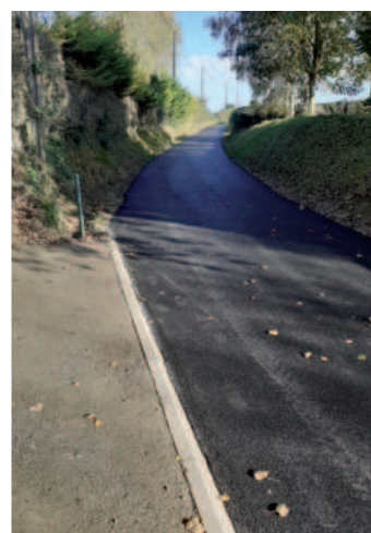
MMU Rue Concogne : Ducrocq TP Coût : 439 622.20 € Subvention : 97 192.75 € Département + 71 567.63 € CAPSO Coût Commune : 270 861.82€