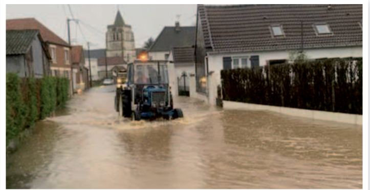
Rue du Centre