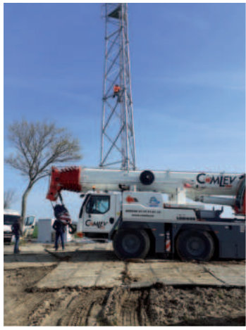
Implantation d'une antenne Orange