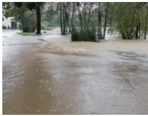
Chemin des Meuniers