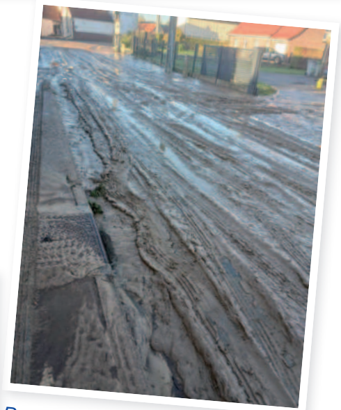
Rue du Marais