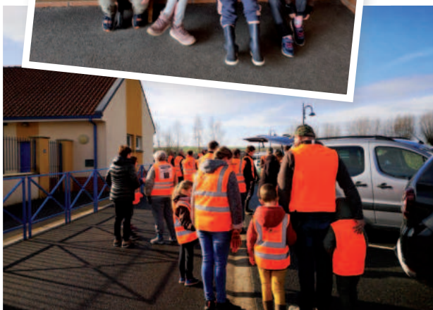
Opération Hauts de France propres en partenariat avec le Foyer Rural et la société de chasse.