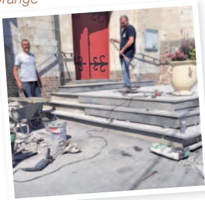
Réparation du parvis de l'église, Elus