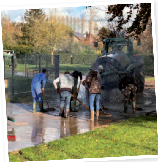
Nettoyage à Westrehem