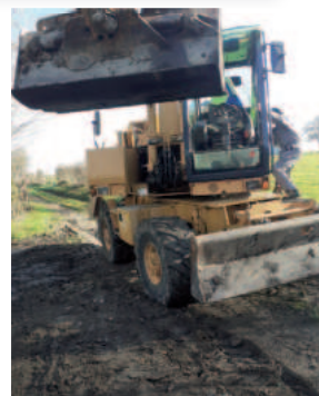
Chemin de Carluis Nettoyage et aménagement d'une parcelle privée polluée avec accord des propriétaires pour mise à disposition du public. G. Denuncq