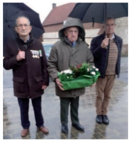
Le 5 décembre 2023.