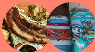
RESTAVRACIJA PR'PEPET DRUŠTVO VARNA HIŠA GORENJSKE

PODPRITE DRUŠTVO VARNA HIŠA GORENJSKE, POMAGAJTE PRI NAKUPU OTROŠKIH KOLES IN OBNOVI SOB V VARNI HIŠI