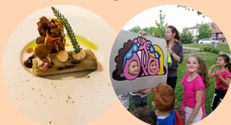
BISTRO ŠTORJA DRUŠTVO PRIJATELJEV MLADINE OBČIN POSTOJNA IN PIVKA

IZVAJANJU DELAVNIC ZA PREPREČEVANJE MEDVRSTNIŠKEGA NASILJA