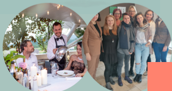
DVOREC GREGORIČ DRUŠTVO ŽIVLJENJE BREZ NASILJA

PODPRITE DRUŠTVO ŽIVLJENJE BREZ NASILJA, POMAGAJTE ŽRTVAM NASILJA ZGRADITI NOVO VARNO ŽIVLJENJE