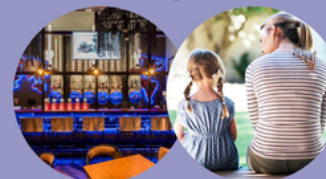
BUNKER – POSTAPOKALIPTIČNI STEAMPUNK BAR DRUŠTVO VARNA HIŠA POMURJA

PODPRITE DRUŠTVO VARNA HIŠA POMURJA, DENAR NAMENITE ZA UREDITEV ZAPRTE TERASE IN REŠEVANJE PROSTORSKE STISKE V VARNI HIŠI