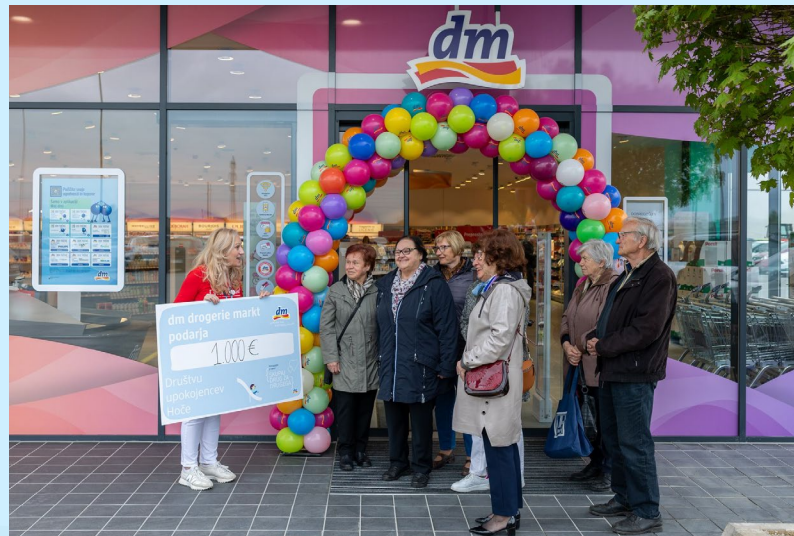
Donacija v sklopu lokalnega marketinga