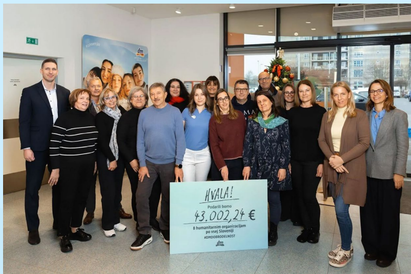
Donacija v sklopu Dobrodelnega petka