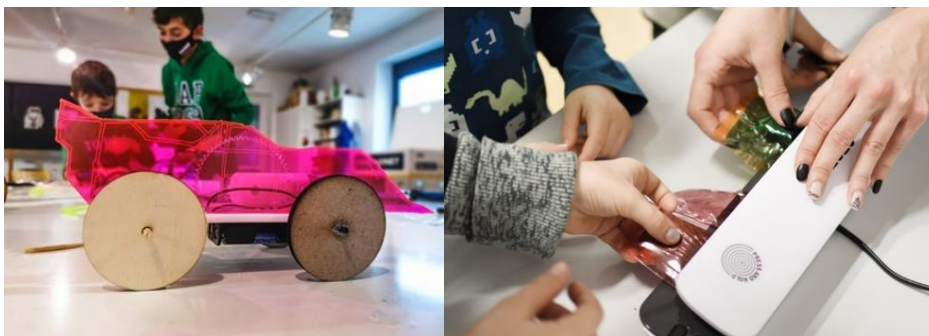
Fotografiji zgoraj sta z otroških delavnic izdelave električnega avtomobilčka (levo) in molekularnih cukrčkov (desno). Obe delavnici sta bili izvedeni v letu 2021.

Na podlagi članske izkaznice in plačane osnovne članarine ter kot nadgradnja - uporabnine posamičnih strojev, kotizacije za usposabljanja ali izobraževalne delavnice - bodo skupni proizvodni laboratoriji zainteresiranim na voljo vsak dan, z rezervacijo prostih terminov ali udeležbo v skupinskem izobraževanju.