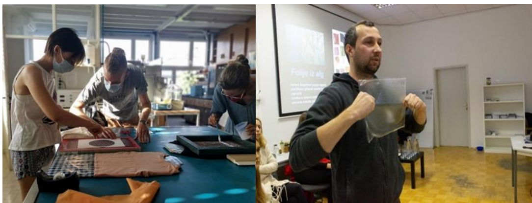
Fotografiji zgoraj: Tečaj tiskanja s termokromnimi barvili (levo) in delavnica Trajnostni in inovativni biomateriali (desno), obe izvedeni leta 2021, prod. Center Rog s partnerji; NTF in Kemijski inštitut.