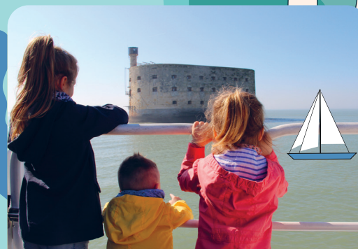
Croisières en mer