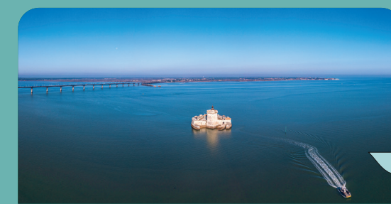
Escapades vers les îles - Fort Louvois

CROISIÈRES, MUSÉES, VISITES GUIDÉES, SITES & ACTIVITÉS