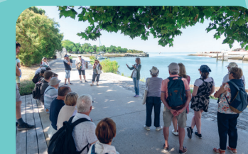
Visites guidées - La Rochelle, Saintes, Brouage