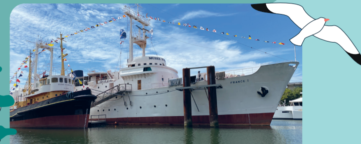
Musées - Musée Maritime de La Rochelle

Over 40 activities, including museums and heritage sites, sightseeing attractions and cruises, list of partners can be found on the back.