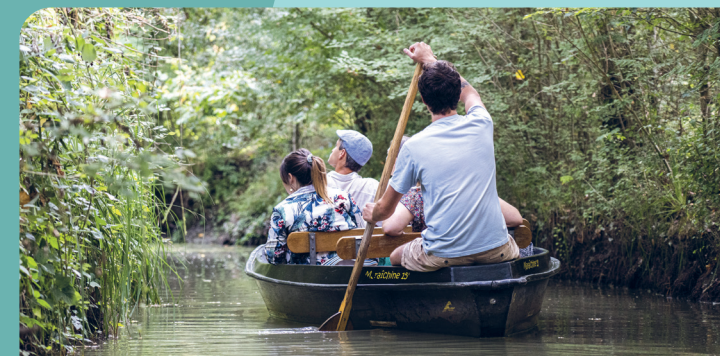
Balades en barque dans le Marais poitevin