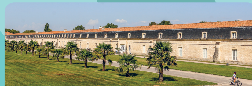
Sites historiques - Corderie Royale de Rochefort