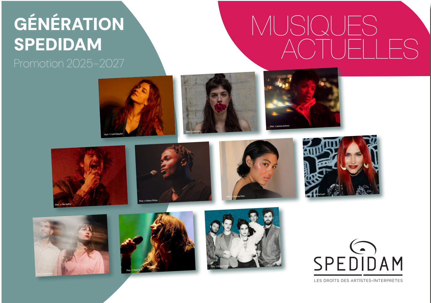
Fascicule « Génération SPEDIDAM MUSIQUES ACTUELLES »