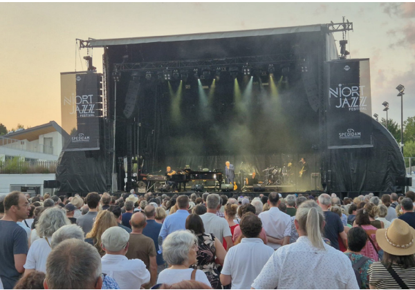
Niort jazz Festival