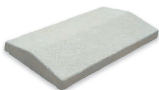
Chaperon de mur 2 pentes Mistral avec goutte d'eau aspect martelé en béton design

Pour faciliter les finitions extérieures de votre maison, nous vous proposons une collection d'accessoires en béton décoratif ou béton design (anciennement appelé pierre reconstituée), parfaitement adaptée à vos besoins : pose simple, rapide, le bloc pilier en béton pourra être habillé avec l'enduit de votre façade, des parements de mur ou du bardage. Les chaperons de mur destinés à couvrir vos murs de clôture sont équipés de « gouttes d'eau » permettant l'évacuation de la pluie sans tacher le mur.