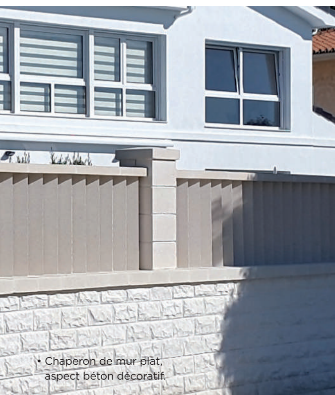
• Chaperon de mur plat, aspect béton décoratif.