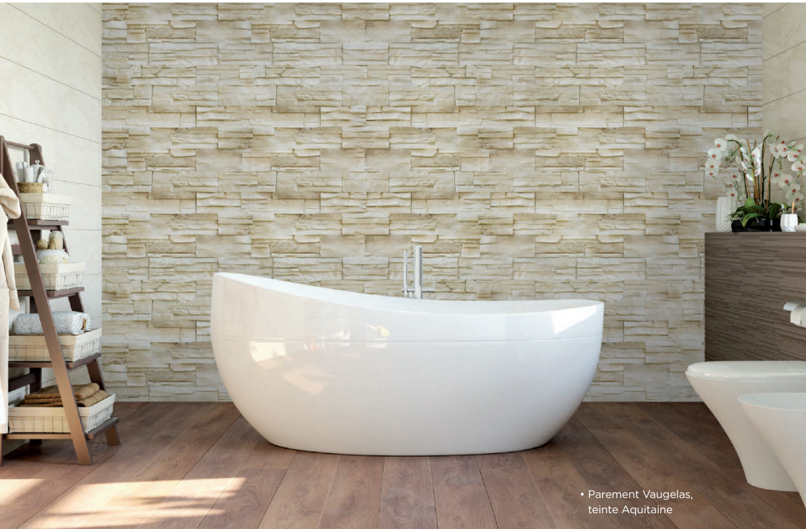
• Parement Vaugelas, teinte Aquitaine