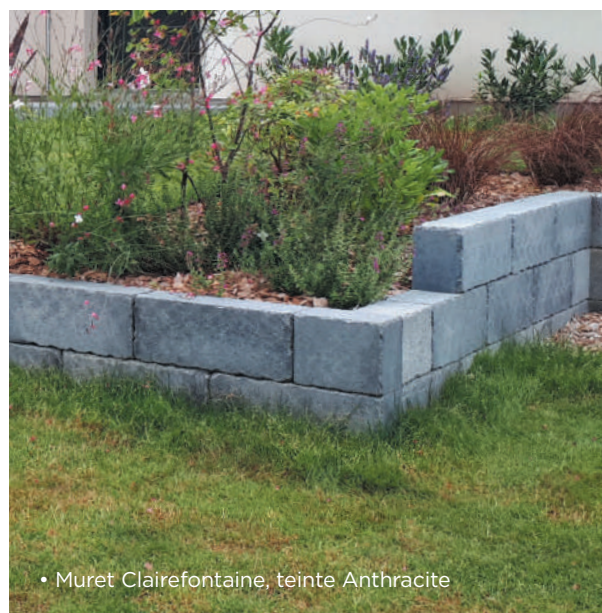
• Muret Clairefontaine, teinte Anthracite