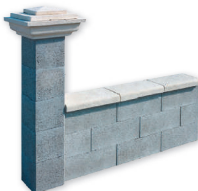
Mise en situation bloc pilier et chaperons de mur en béton décoratif

Bloc Pilier : Le bloc pilier en béton gris est destiné à être enduit. Hauteur 25 cm. Dimensions extérieures : 20 x 20 / 26 x 26 / 35 x 35 / 40 x 40 / 50 x 50 cm Facile d'emploi et polyvalent.