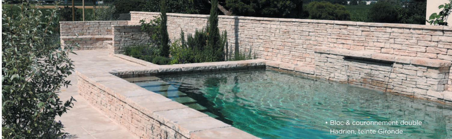
• Bloc & couronnement double Hadrien, teinte Gironde