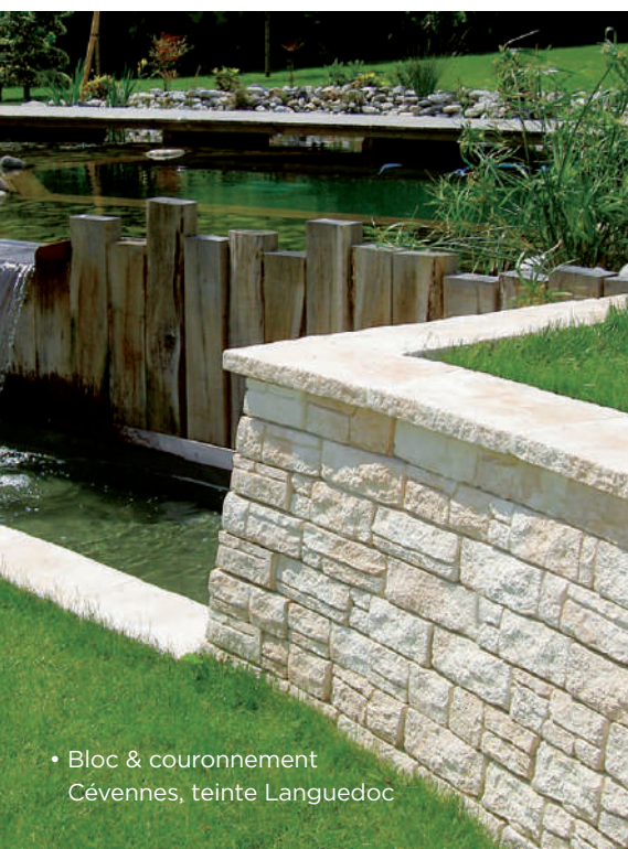
• Bloc & couronnement Cévennes, teinte Languedoc