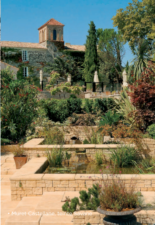
• Muret Castellane, teinte Savane