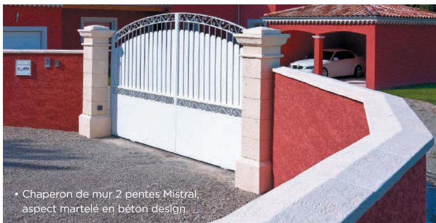
• Chaperon de mur 2 pentes Mistral, aspect martelé en béton design.