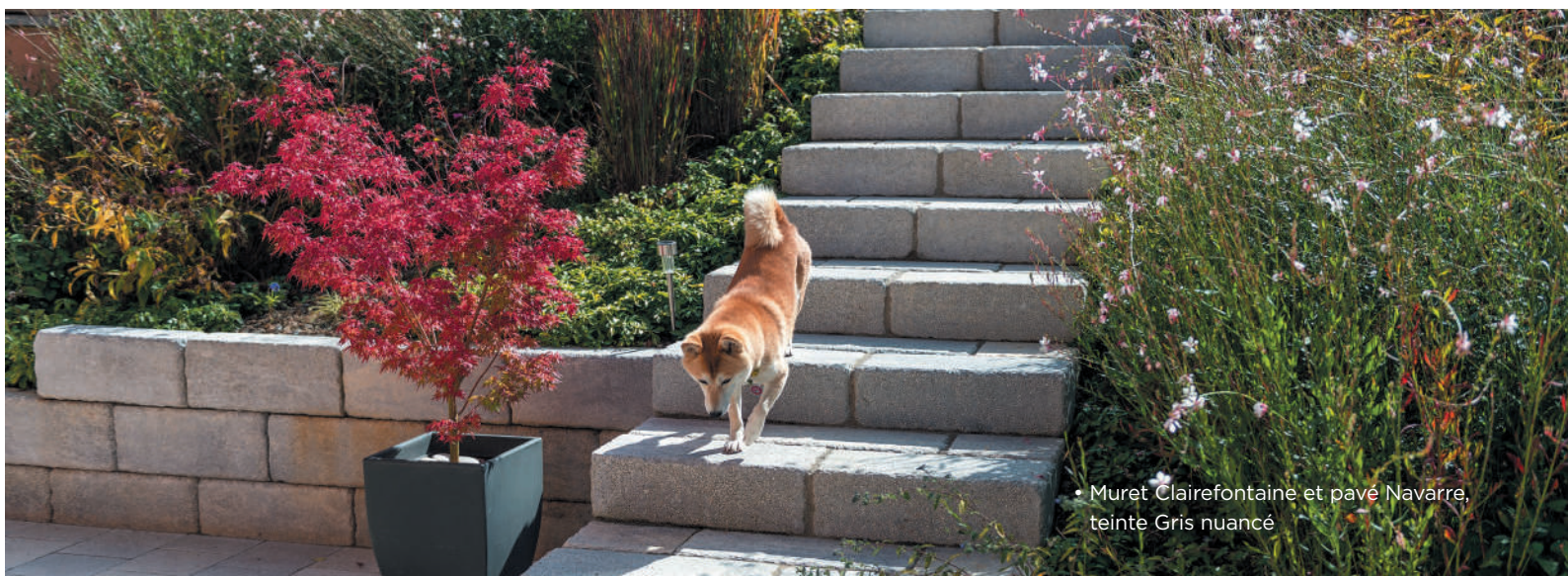
• Muret Clairefontaine et pavé Navarre, teinte Gris nuancé