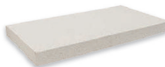
Chaperon de mur plat avec goutte d'eau en béton décoratif

Autres dimensions et teintes, nous consulter.