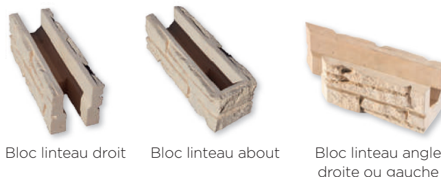
Bloc linteau droit