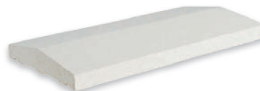
Chaperon de mur 2 pentes avec goutte d'eau en béton décoratif