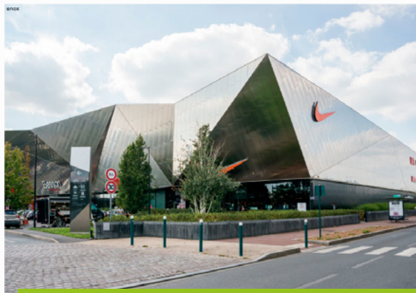
Retail park Enox – Av. du Vieux Chemin St-Denis – Genevilliers (92)

Le 8 juillet 2022, votre SCPI a acquis le retail park Enox conçu par l'architecte italien Gianni Ranaulo. Cet actif affiche une identité visuelle unique grâce à ses formes anguleuses et dynamiques. Le retail park Enox est situé dans une zone de chalandise importante, proche de Paris et facilement accessible en transports en commun et en voiture. L'ensemble est entièrement loué à 9 enseignes nationales.