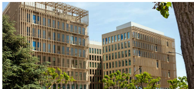
▲ 126-138 avenue de Stalingrad - VILLEJUIF (94)

Il conviendra, pour les associés désirant se porter candidat à un poste de Membre du Conseil de Surveillance et remplissant les conditions ci-dessus énoncées, de faire parvenir à la Société de Gestion avant le 31 mars 2023, un courrier de motivation indiquant leur nom, prénom, âge, le nombre de parts qu'ils possèdent, leurs références professionnelles, la liste de leurs activités au cours des 5 dernières années et de tous les mandats sociaux qu'ils exercent. Des formulaires pour postuler sont disponibles sur notre site Internet.