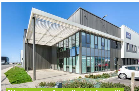
71 bis et ter, rue Henri Gautier - Montoir-de-Bretagne (44)

Le premier trimestre 2022 a été marqué par le renouvellement de l'Agence Régionale de Santé (ARS) sur l'immeuble Onix situé au 556-594, avenue Willy Brandt à Lille (59). Le locataire s'est engagé pour une durée ferme de 12 ans. Par ailleurs, la réitération de la promesse de vente de l'immeuble situé au 16, rue Gay Lussac à Gonesse (95) est intervenue le 30 mars 2022, pour un montant net vendeur de 7,5 M€.