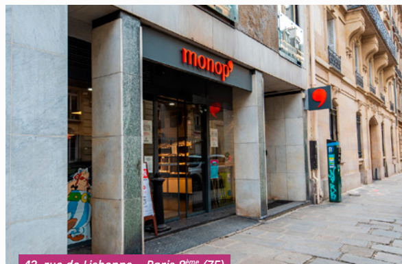
43, rue de Lisbonne - Paris 8 ème (75)

Le taux de distribution 2022 est en forte hausse à 5,58 % (contre 3,88 % en 2021).