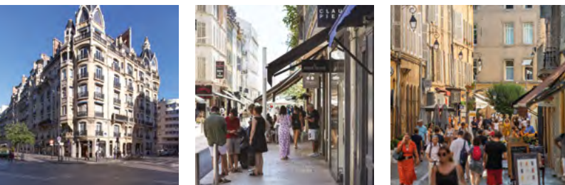
Rue de Courcelles, Paris 17 e