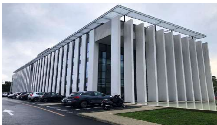
Immeuble de bureaux Le Ferry (33), d'une surface de 4 690 m 2 et loué à Natixis et la CPAM de Gironde.